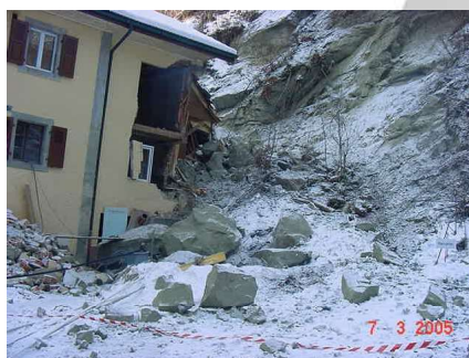
Mesures de consolidation, vallée du Gottéron